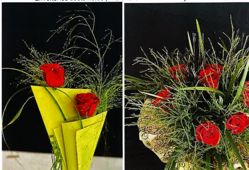
Envoltorios sostenibles para una floristería actual y comercial