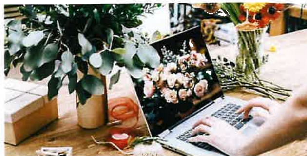
GUÍA DEL EMPRESARIO FLORISTA

Además, en el marco de este convenio se ha actualizado la Guía del Empresario Florista , que se revisa en todas sus páginas con ampliación de contenidos a lo largo de sus actuales 280 páginas. Es una herramienta muy útil para consultar información de interés y, en muchos casos de carácter obligatorio en el ámbito de la empresa, con especial hincapié en aspectos aplicados a floristería. La profusión normativa que se está produciendo en los últimos años hace muy conveniente la actualización anual, manteniéndose así como una guía dinámica y en constante evolución.